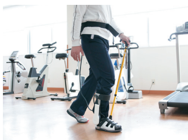
ロボットリハビリテーション

ロボットスーツ HAL、Honda 歩行アシスト、足首アシスト装置 CoCoroe AAD、ウォークエイド、上肢リハビリ機器 CoCoroe AR2、IVES、MURO ソリューションの7つの機器を臨床へ導入し、臨床で得たデータを活用した研究や学会発表も行っています。