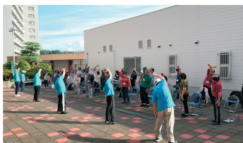
地域リハビリテーション

ロボットスーツ HAL、Honda 歩行アシスト、足首アシスト装置 CoCoroe AAD、ウォークエイド、上肢リハビリ機器 CoCoroe AR2、IVES、MURO ソリューションの7つの機器を臨床へ導入し、臨床で得たデータを活用した研究や学会発表も行っています。