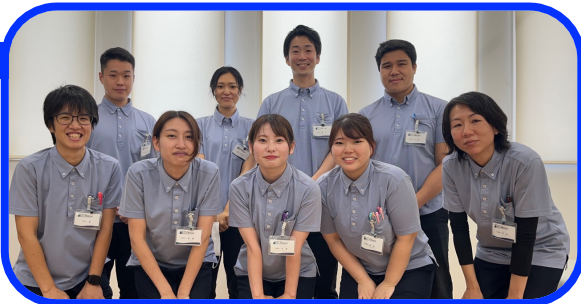
リハビリテーション科スタッフ

本院スタッフは、各々が意図を持ち、患者様にとって意味のある存在となれるように、日々研鑽しています。その中で互いにサポートし合いながらたくさんの壁を乗り越えられる環境です。私たちと共に成長し、共に挑戦するスタッフを募集しています。