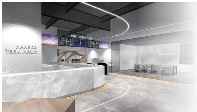
イノベーションシティ完成イメージ

https://www.tokyo-airport-bldg.co.jp/terminal0/