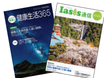
会員情報誌『健康生活365』『イアシス通信』