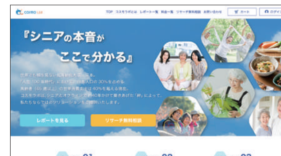
シニア特化型のマーケティングリサーチを展開する『コスモラボ』。