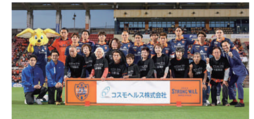
2023年5月、清水エスパルス本拠地にてコスモヘルスマッチを実施。「シニアエスコート隊」を実現しました。

健康と密接な繋がりを持つスポーツ業界に貢献するため、2020年に日本プロゴルフ協会のシニアツアー公式スポンサーに就任。コスモヘルスカップは2024年に第5回を迎えます。また2023年には、Jリーグ清水エスパルスとクラブパートナー契約を締結いたしました。