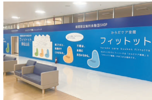
体験型ショールームの様子