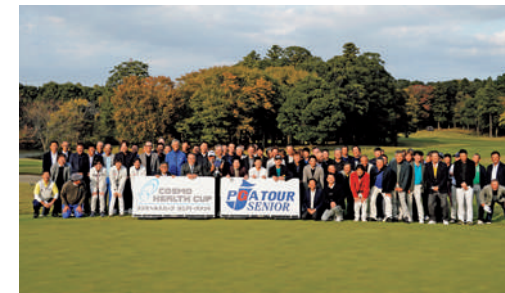
弊社主催のコスモヘルスカップにて。ツアー前日には、選手を対象に予防セミナーも主催しています。

プロゴルファーの体を守る国内唯一の設備「フィットネスカー」。弊社医療機器が全種導入されています。