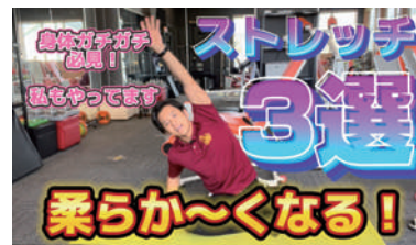
動画コンテンツも豊富です。