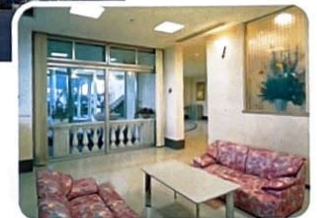
● エントランスロビー