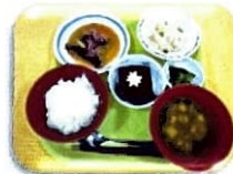
デザートもあります♪