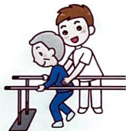
平行棒内歩行訓練